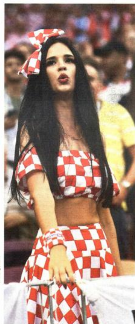
Ova dama meta je brojnih fotografa