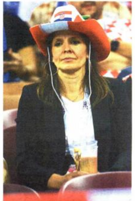
Kaubojski šešir i »kockice«? Zašto ne