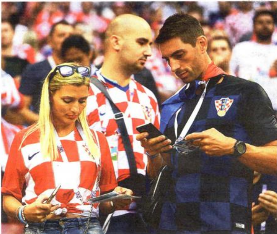
A sad brzo na društvene mreže