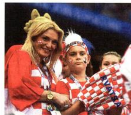
Može jedna za Novi list? Ma može

BROJNI POZNATI I ČLANOVI OBITELJI NAKON POLUFINALA OSTALI SU U MOSKVI