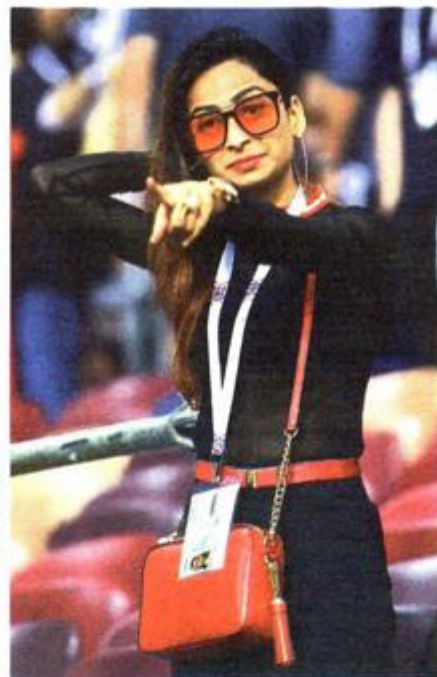
I ja navijam za Hrvatsku!