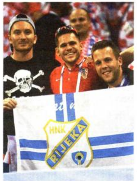
Rijeka u Moskvi